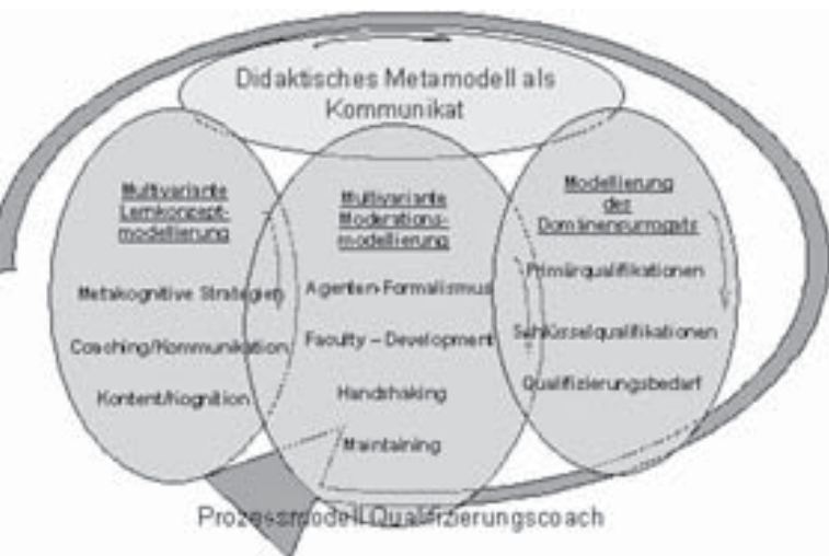
Didaktisches Metamodell als Kommunikat

Das didaktische Konzept baut auf die Hypothese, dass Schlüsselkompetenzen in virtuellen Unternehmen nicht als statische Wissensbasis zu fassen sind und damit von einer Konstruktion bzw. Rekonstruktion einer Enzyklopädie als Domäne auszugehen ist. Ein didaktisches Metamodell kann deshalb nicht auf eine vorgegebene Struktur von didaktisch relevanten Metadaten für Qualifizierungsabsichten und Qualifizierungsinhalte ausgehen sondern muss sie in einem dynamischen Prozess der Domänenkonstruktion und seiner Reproduktion als Kommunikat zu beschreiben und zu modellieren versuchen.